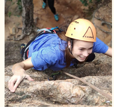
L'ARI I EL JAN